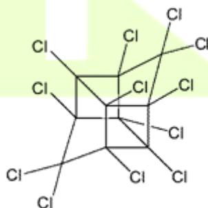
Obrázek 1: Struktura mirexu

Mirex je bílá krystalická látka bez zápachu, která taje při 485 °C. Je rozpustný v mnoha organických rozpouštědlech (tetrahydrofuran, sirouhlík, benzen, chloroform), ve vodě se rozpouští jen minimálně (0,6 mg.l -1 ). Mirex představuje látku extrémně stabilní – nereaguje ani se silnými oxidačními činidly, jako je chlor nebo ozón. Ve formě technické směsi obvykle obsahuje 95,19 % mirexu a 2,58 % chlordeconu. Struktura mirexu je uvedena na obrázku 1. Má podobnou strukturu jako chlordecon.