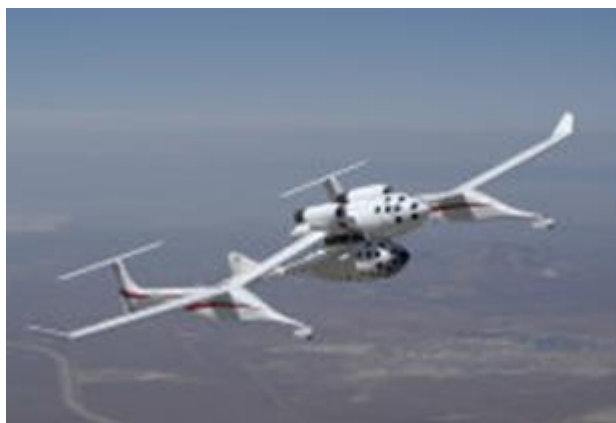
Obrázek 1: SpaceShipOne, první soukromé letadlo, které uskutečnilo let na hranice atmosféry (2004). Oxid dusný byl využit jako oxidovadlo v raketovém motoru.